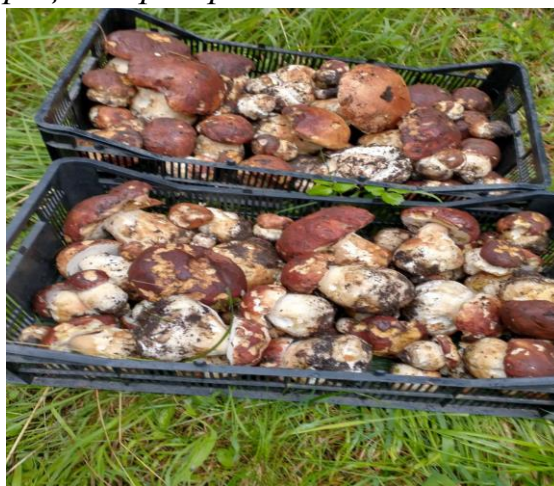
детайли от проведено обучение през 2024